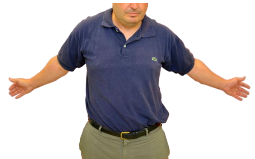
Extiende los brazos y lléalos hacia atrás, con el pecho hacia adelante. Mantén unos segundos y relaja.