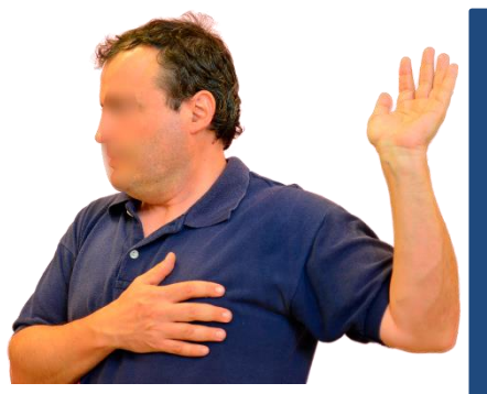
Con el codo flexionado y apoyado sobre una pared, gira la cintura escapular