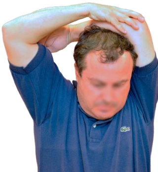
Lleva el brazo por detrás del cuello flexionándolo y sujétalo con el brazo contrario a nivel del codo, mantén dicha postura ejerciendo presión hacia abajo unos segundos y relaja.