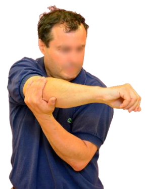
Cruza el brazo por delante del cuerpo de forma totalmente estirada a la altura del hombro. Con el otro brazo le ayudamos a tirar hacia atrás. De este modo estiramos el hombro.