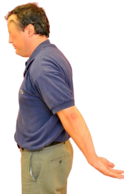
Con el brazo estirado muévelo hacia atrás.